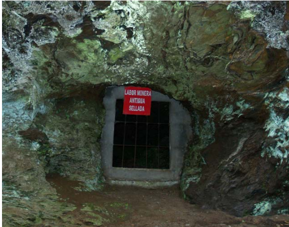
Imagen 2. Uno de los tipos de cierre utilizados en el plan de sellado de la Consellería de Industria a principios de la década de 2000 (Muras, Lugo).

En Galicia, el plan de sellado realizado por la Consellería de Industria a finales de la década de 1990 y principios de la actual, cerró cientos de minas de galería sin un estudio previo sobre su importancia para las poblaciones de murciélagos. Se utilizaron, además, diferentes tipos de cierres no adecuados para el paso de murciélagos, principalmente muros de bloque y mallas metálicas.