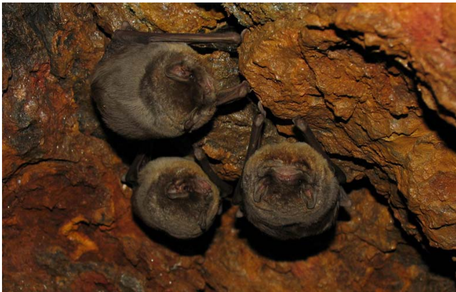
Imagen 1. Miniopterus schreibersii en una mina gallega.

Algunas especies de murciélagos típicamente cavernícolas, como las especies del género Rhinolophus , han desplazado sus colonias de cría mayoritariamente a construcciones humanas. El murciélago de cueva, Miniopterus schreibersii , en cambio, es estrictamente cavernícola y su conservación depende de la adecuada protección de los refugios que utiliza. Esta especie forma enormes colonias de cría e hibernación y a ella corresponde la mayor colonia de murciélagos de Galicia, con más de 3.000 ejemplares adultos en la misma mina (Drosera, datos propios). Los refugios subterráneos son utilizados asiduamente por las especies del género Myotis y por las dos especies de Plecotus . Se han encontrado también Pipistrellus pipistrellus , Hypsugo savii , Barbastella barbastellus o Tadarida teniotis .